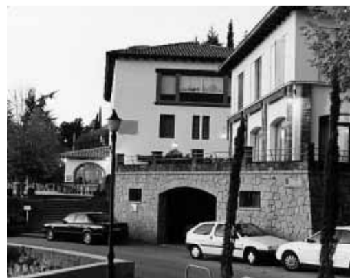
Un bello hostel en el corazón del Montseny

■ El hotel hostel de la Glòria no podría tener una mejor ubicación. Instalado en Viladrau, en el corazón del bello parque natural del Montseny y a 840 metros de altitud, en unas casitas construidas según los cánones de la arquitectura de montaña que facilitan la perfecta integración en el entorno natural, se trata del lugar ideal para desconectar. Ideal porque ofrece únicamente 26 confortables habitaciones y porque todas ellas están equipadas para que uno se sienta cómodo, confortable y no eche en falta absolutamente nada. Una cafetería con vista privilegiada al parque natural, la